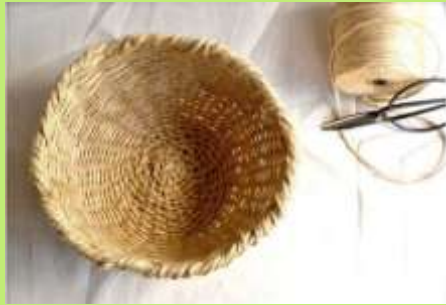
Корзина для сладостей