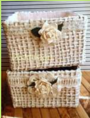
Корзина для бумаг