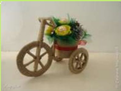
Кашпо для цветов